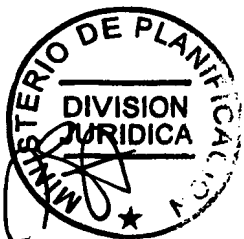
Gonzalo Arenas Valverde SUBSECRETARIO DE PLANIFICACIÓN